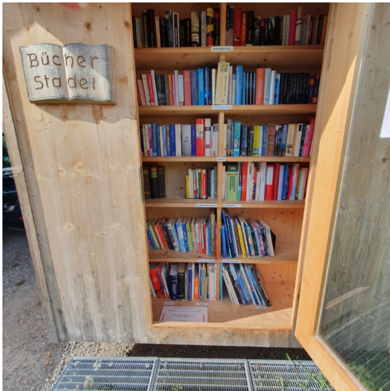
Bücherstadel am Busheisl beim Haus für Kinder

Größere Buchbestände bitte abgeben bei Frank Orthey (0172/8231112). Dort gibt es ein „Depot“, aus dem Bücherregal und -stadel ergänzt werden.